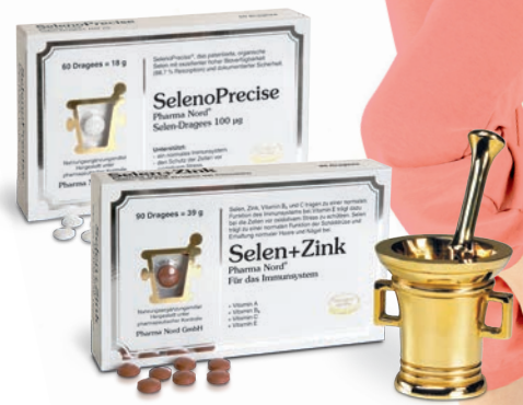
1: Zn. 2: Vit. C. 3: Vit. B6. 4: Se. 5: Vit. E. 6: Vit. A.

Trägt zu einem normalen Energiestoffwechsel und zur Verminderung von Müdigkeit bei 2,3